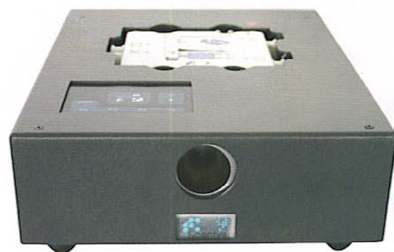
Der Duftdispenser Scentys4